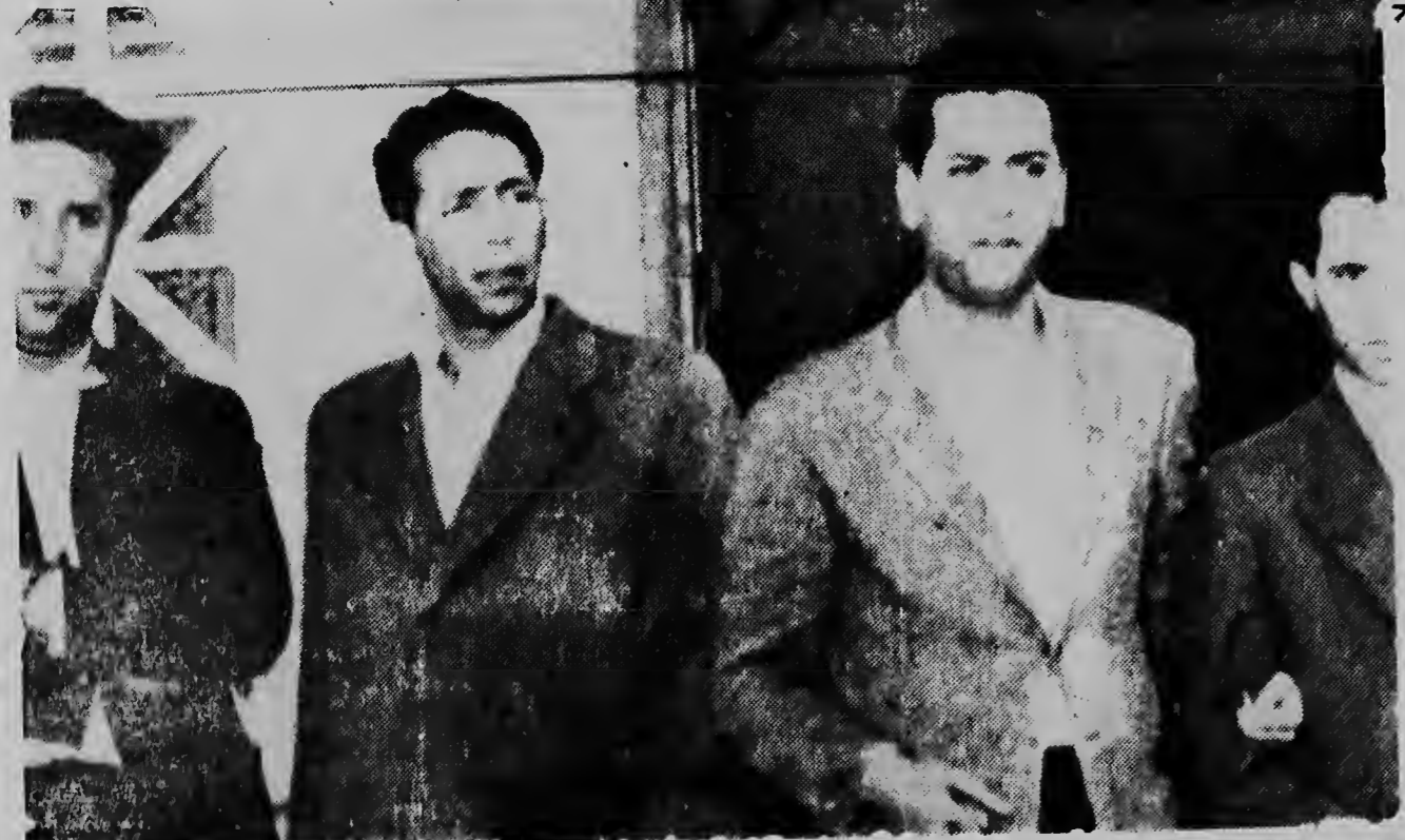
Ejercito frances a obliga e aeroplano cu e lidernan di e revolucionarionan algerino tabata bai cune di Rabat pa Tunis baha, y a arresta e lidernan el. Nan intencion tabata pa hasi uso di e invitation di e premier di Tunisia, Habib Boerguiba, pa ta presente el durante di e bishta di e sultan Mohammed Ben Joesef na Tunis. ta muestra cuater di e cinco lidernan arresta i na boel na Alegria. Di robes pa drechi: Ahmed Ben Bella, Boudiaf, Ait Hossine y Ahmed Lachraf.